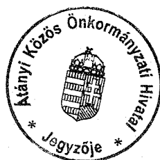
Dányiné Szórád Ibolya